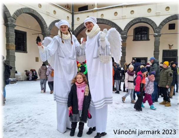
Vánoční jarmark 2023

Vychutnejte si kouzelnou předvánoční atmosféru s bohatým stánkovým prodejem vánočních dárků a pochoutek, pestrým kulturním programem a tvořivými dílničkami pro děti. Nezapomeňte si přinést dobrou náladu a prožijte den plný radosti a vánoční pohody.