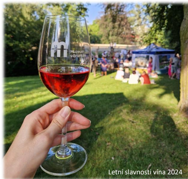
Letní slavnosti vína 2024

Třetí ročník Letních slavností vína na zámku Bruntál byl opět neskutečný! Zámecký park ožil hudbou, tancem a samozřejmě výborným moravským vínem. Děkujeme všem 460 návštěvníkům, kteří přišli a podpořili tuto skvělou událost. Těšíme se na další ročník!