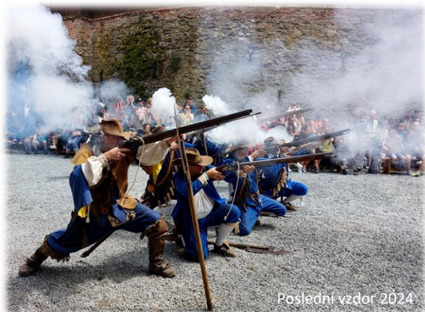
Poslední vzdor 2024

První srpnový víkend byl jako obvykle věnován třicetileté válce a dobývání hradu Švédy. Nesl se ve znamení výstřelů z mušket a děl, šermířských šarvátek a půtek. Po oba dny po poledni probíhala divadelní rekonstrukce obléhání hradu švédskou armádou v roce 1643. To byl zlatý hřeb celodenního víkendového programu, kterého se účastnili mušketýři a šermíři z celé republiky.