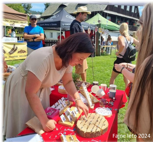
Fajne léto 2024

27. července jsme strávili báječný den na akci Fajne léto v Karlovicích (více na www.technotrasa.cz ). Dojili jsme kozu, učili se prát na valše, zatloukali hřebíky a mnoho dalšího. Díky spolupráci se Střediskem volného času Bruntál byl program opět velmi pestrý a celou sobotu jsme si skvěle užili.