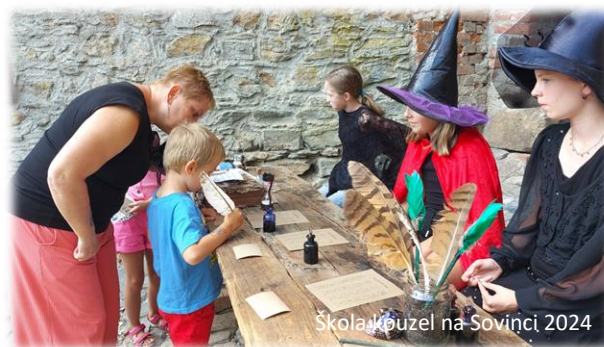
Škola kouzel na Sovinci 2024

Na každém z nich dostali po splnění úkolu razítko a když jich nasbírali všech dvanáct, vrátili se zpět na studijní oddělení pro svůj kouzelnický diplom a malou odměnu.