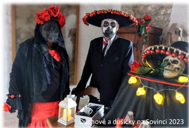
Duchové a dušičky na Sovinci 2023

Pokud se rádi trochu bojíte, nezapomeňte dorazit k nám na hrad Sovinec. Během celého víkendu na vás čekají netradiční prohlídky plné duchů, strašidel, pověstí. Výjimečně budou také probíhat prohlídky hradních púd a sklepů.