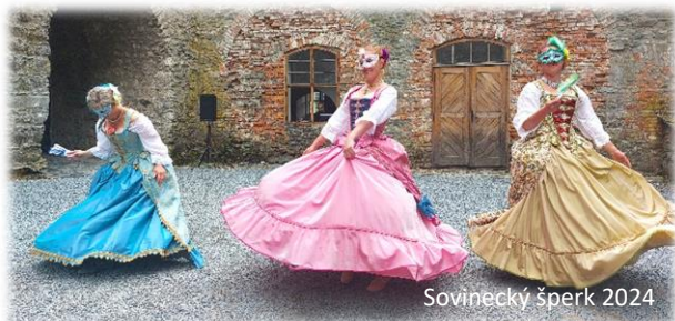
Sovinecký šperk 2024

Na začátku prázdnin se na Sovinci uskutečnil již tradiční šperkařský jarmark. K vidění bylo mnoho druhů šperků z cínu, mosazi, dále šperky dřevěné, skleněné a mnohé další. Někteří šperkaři přímo na místě předváděli jejich výrobu. Nemohl chybět ani doprovodný program na pátém nádvoří, kde se návštěvníkům představili šermíři, tanečnice, žonglér nebo sokolník.