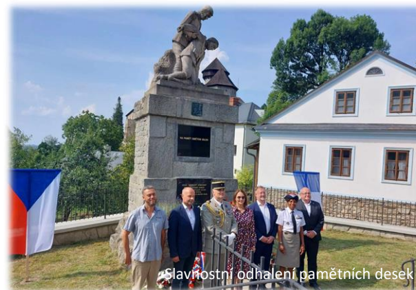
Slavnostní odhalení pamětních desek